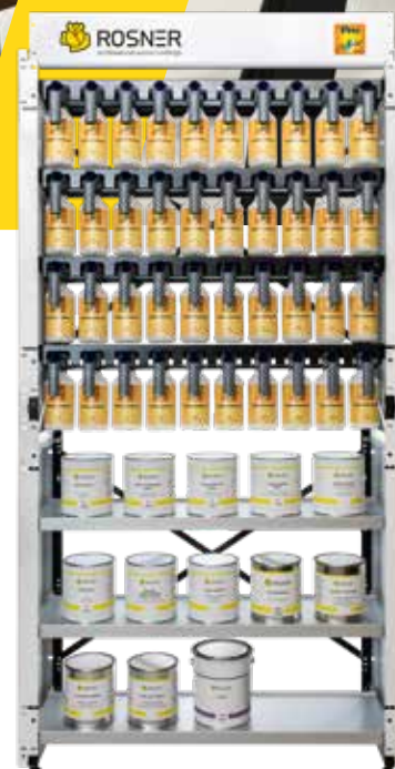
Item no.: 249410008